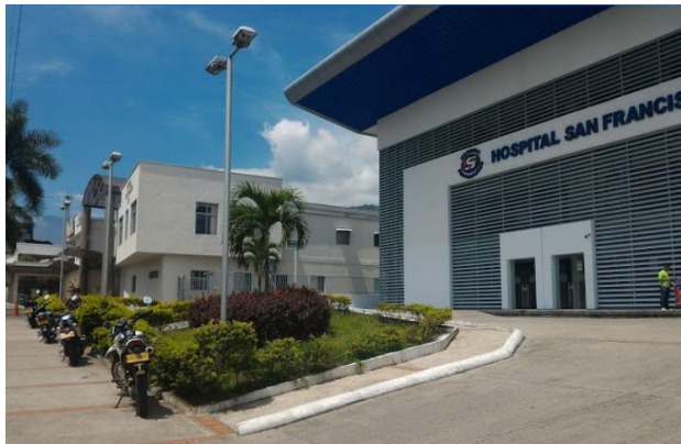
U.S.I. – U.I. HSF