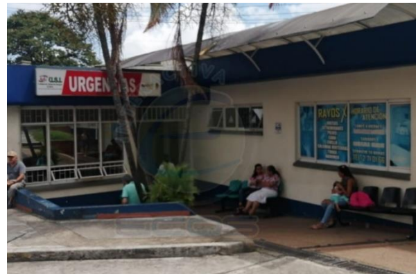
U.S.I. – U.I. JORDAN 8ª ETAPA