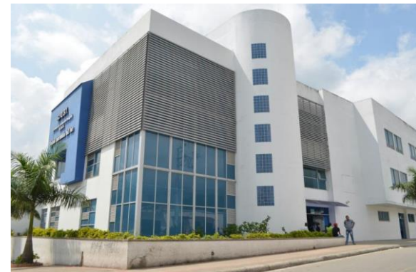
U.S.I. – U.I. SUR